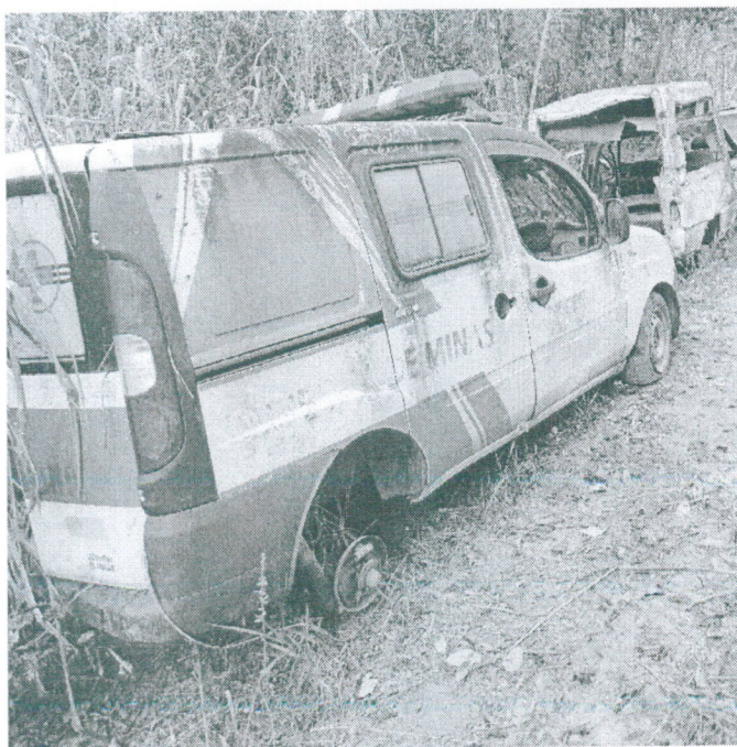
Renault Clio – PYD-9147